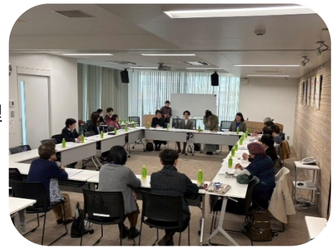
市議と市民が意見交換 男女平等参画センターにて

条例がなぜ必要だったのか、なぜ議員提案としたのか、制定までの経緯について、提案者の一人である私は「女性史レポート」に執筆した資料をもとに説明をしました。特に条例名の共同ではなく平等と