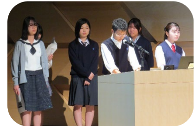
高校生ワークショップ 発表Bチーム

「どのようにしたらジェンダー平等な社会を実現できるのか」についてワークショップで考えた意見や提案を発表しました。